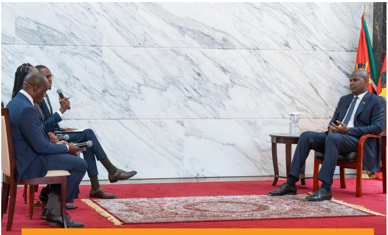
O presidente Chapo numa entrevista colectiva em Fevereiro de 2025 à rádio e televisão públicas moçambicanas e a uma estação de televisão privada.

(...) Existe uma luz ao fundo do túnel. Há uma certa mudança. O presidente já não está com a barreira militar que costumava ir contra a imprensa. Você está com ele (...). Há também o espaço para trabalhar (Entrevistado 5).