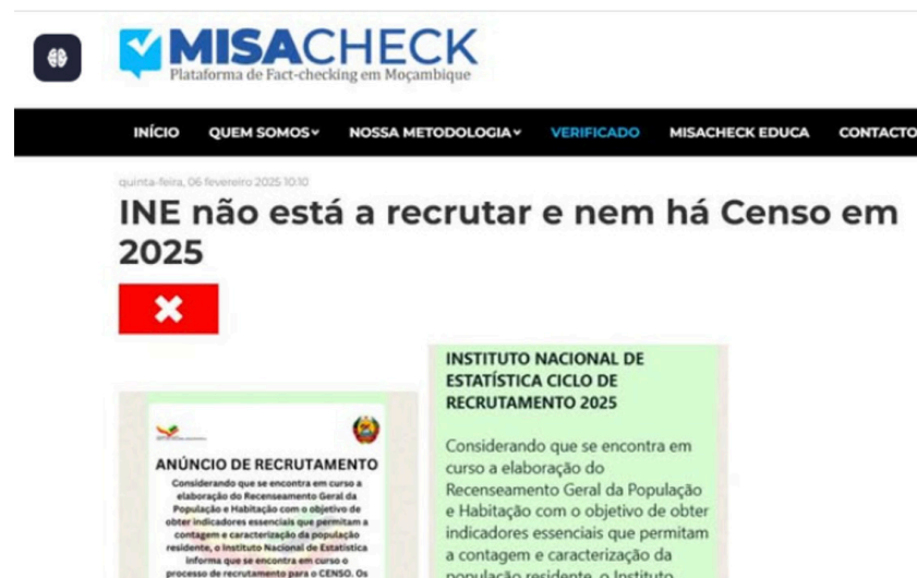
Figura 4: Exemplo de desinformação explorando vulnerabilidades como o desemprego

Na área económica, a desinformação em 2025 incluiu casos de fraude e esquemas de burla digital, frequentemente disfarçados em oportunidades económicas como emprego, ou em programas de apoio social, explorando a vulnerabilidade associada ao desemprego, sobretudo entre jovens. Entre os casos mais relevantes, destaca-se, em Fevereiro, o falso recrutamento no Instituto Nacional de Estatística (INE) para o alegado “Censo 2025”, bem como, em Julho, a falsa iniciativa denominada “Empoderamento Presidencial da Juventude”.