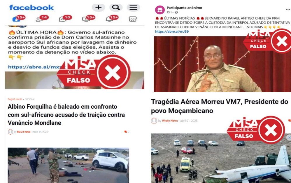
Figura 3: retrato de alguns dos casos de desinformação de 2025 incidindo sobre a área política

Um dos padrões também recorrentes ao longo do ano foi a disseminação de informações falsas sobre mortes, atentados e acidentes envolvendo figuras políticas de destaque. A título de exemplo, alegou-se, em Abril, a morte do presidente da RENAMO, Ossufo Momade, do presidente do ANAMOLA, Venâncio Mondlane, bem como a sua mandatária financeira, Glória Nobre. No mesmo mês, alegou-se também a morte da antiga ministra Verónica Macamo, após um suposto baleamento. Já em Junho, circulou uma alegação de acordo com a qual o ex-comandante-geral da Polícia, Bernardino Rafael, teria sido baleado, enquanto, em Setembro, voltou a surgir a falsa informação da morte de Venâncio Mondlane.